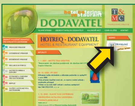
BANNER NA TITULNÍ STRANĚ