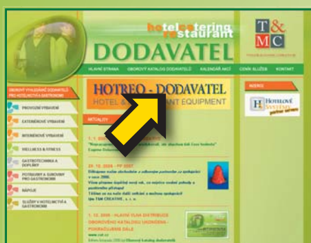
HLAVNÍ BANNER NA TITULNÍ STRANĚ