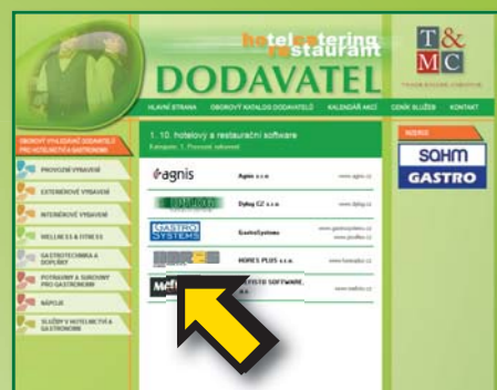
ZÁPIS V OBOROVÉM VYHLEDAVAČI