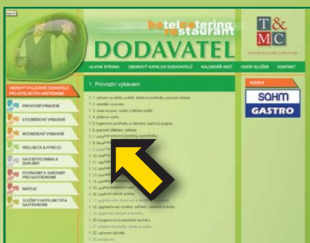
ČLENĚNÍ OBOROVÉ SEKCE DLE NOMENKLATURY