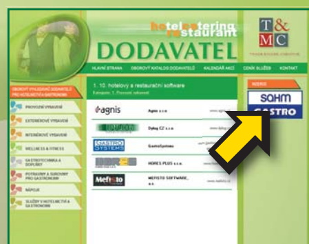
BANNER V OBOROVÉ SEKCI VYHLEDAVAČE